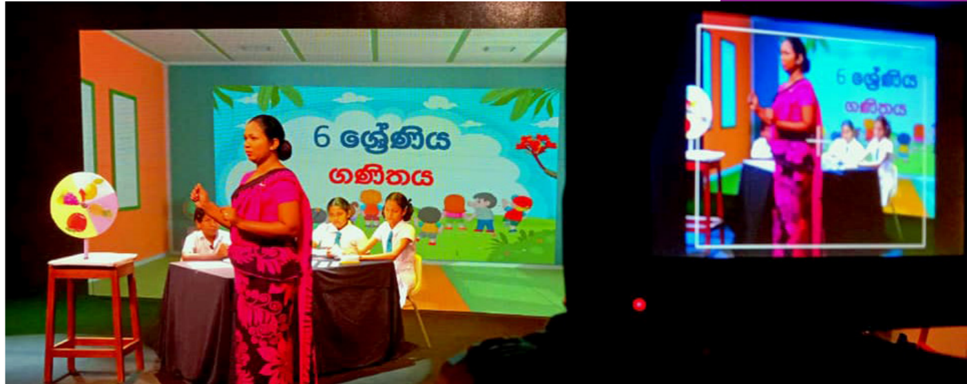
සොඳුරු, කාලෝචිත, ආකර්ෂණීය තීරණයක් ම වූයේ එතෙයිනි.

මේ වන විට විකාශය වූ සියලු ගුරුගෙදර අධ්‍යාපන වැඩසටහන් Channel NIE යු ටීවුබී නාලිකාවෙන් ඛාගන කර ගැනීමට හෝ නැරඹීමට අවස්ථාව ඇත.